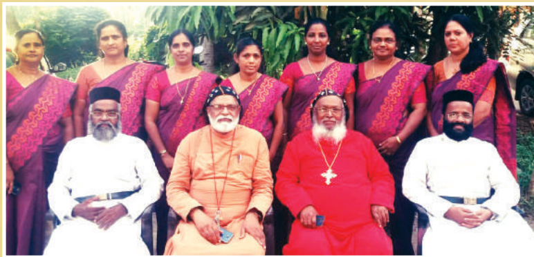
ചങ്ങന്നൂർ ഭദ്രാസന മർത്തമറിയം സമാജത്തിന്റെ പ്രാർത്ഥനാപൂർവ്വമായ ജന്മദിനാശംസകൾ